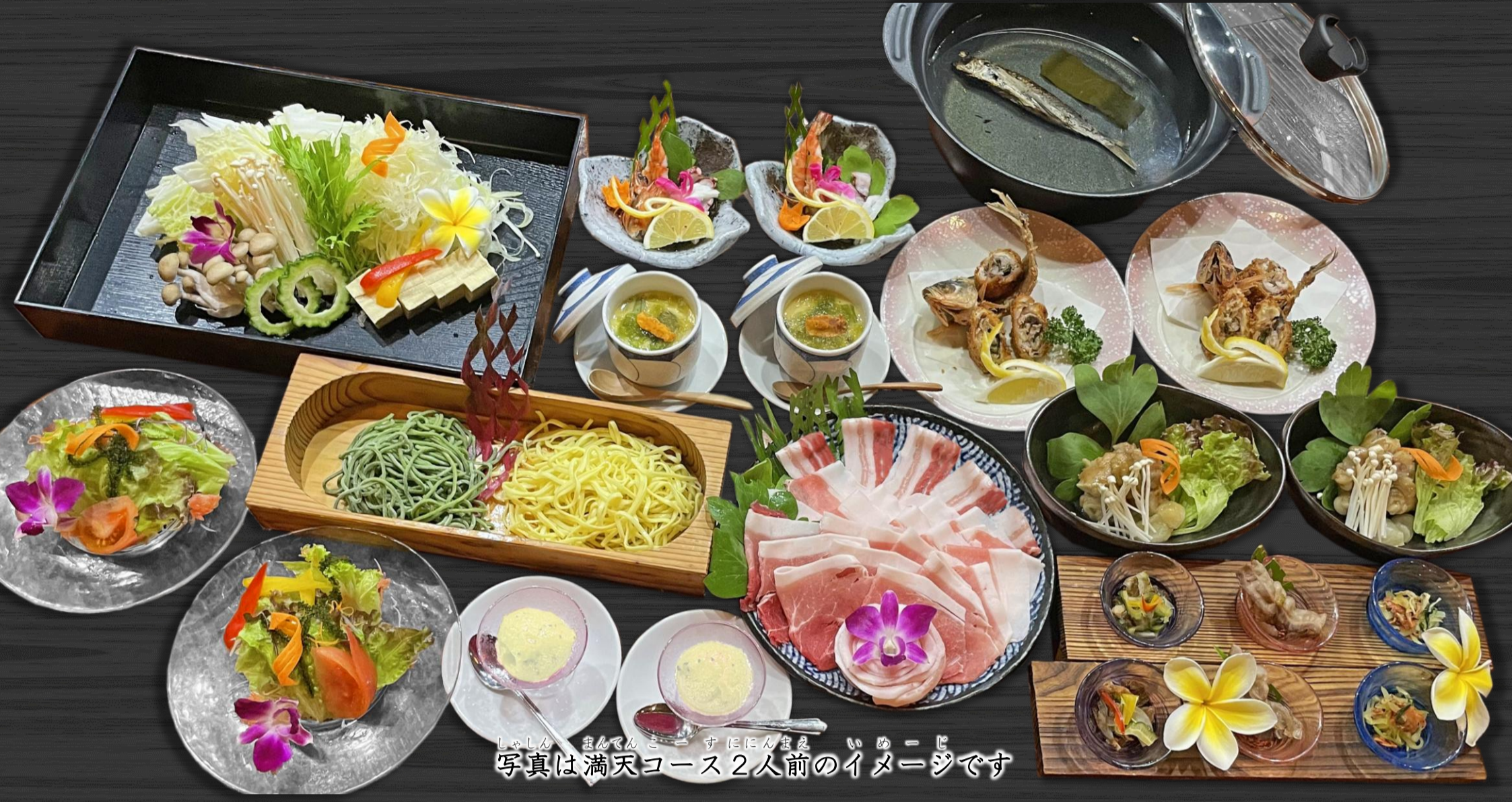
写真は満天コース2人前のイメージです