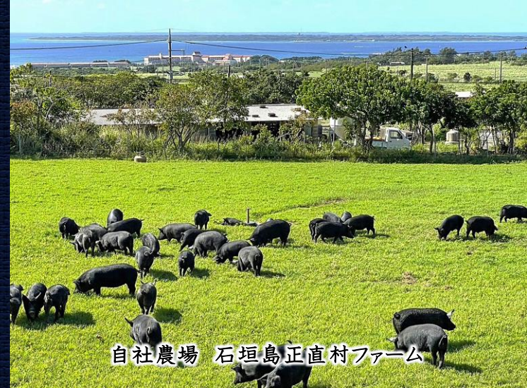
自社農場 石垣島正直村ファーム